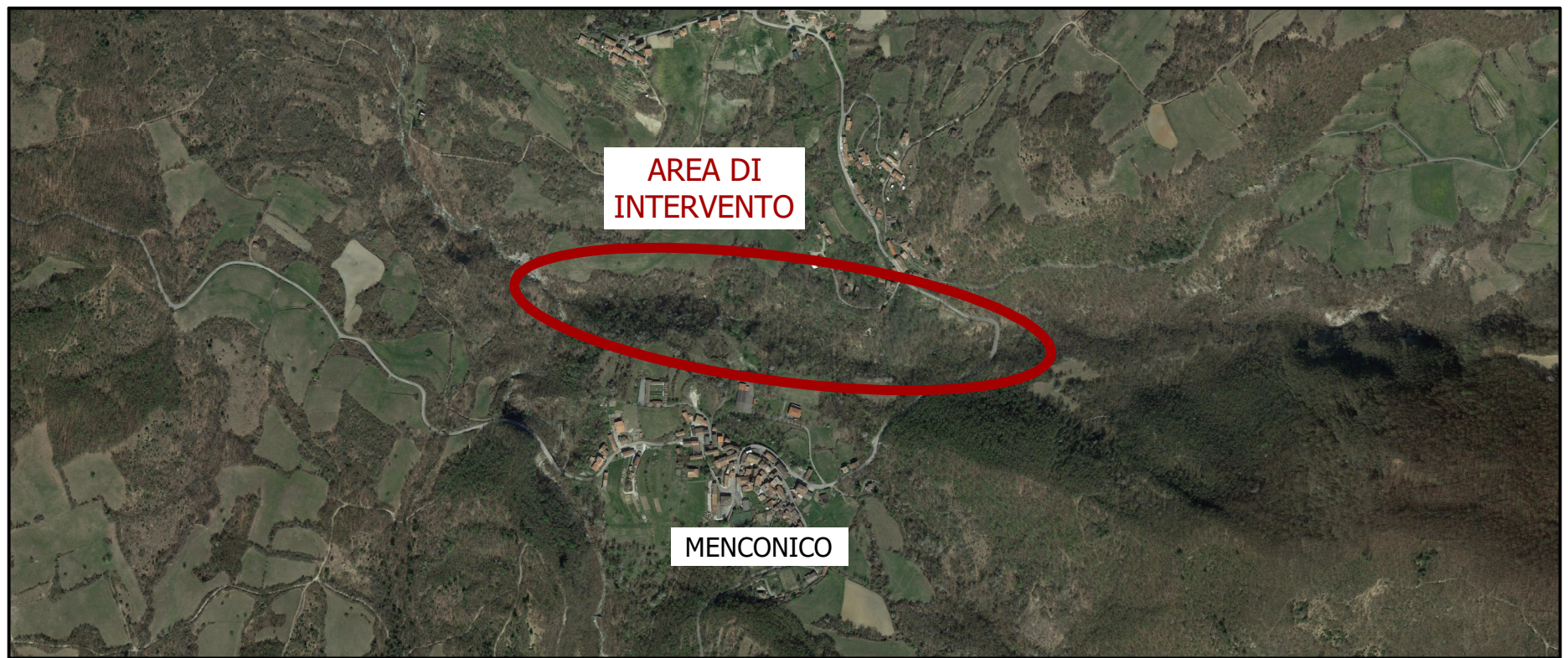
LOCALIZZAZIONE AREA DI INTERVENTO SU IMMAGINE SATELLITARE SCALA 1:10.000